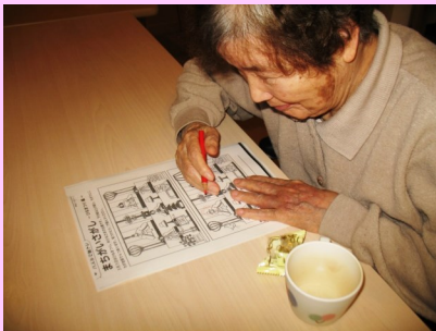
間違い絵探しに取り組まれる利用者様