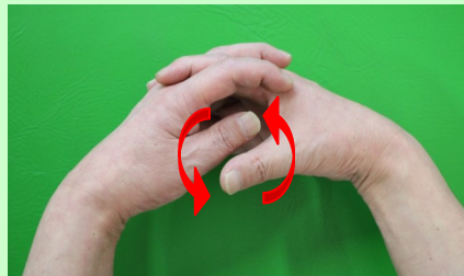
お互いに当たらないように親指を回します。